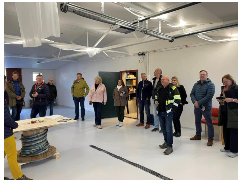
På besøk hos Jonstad Auto

Besøkende fikk oppleve et fremoverlent næringsliv i Alvdal. Kommuneledelse og aktører fra næringslivet viste frem alle de positive resultatene som kommer av gründerskap og samarbeid. Med alt positivt som skjer i næringslivet i Alvdal scorer de godt på NHO sitt næringsbarometer.